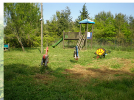
Installations pour les enfants, à démonter...