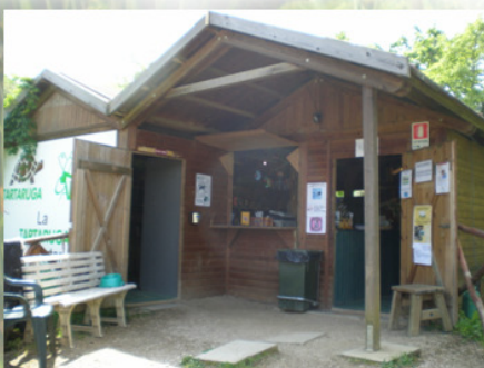
Chalet à l'entrée du centre, à démonter...