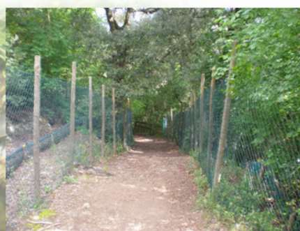
Des kilomètres de grillage à enlever...