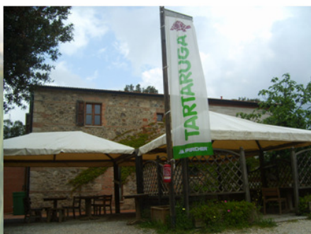
Ruine entièrement réhabilitée par les volontaires de Carapax. Objet de la contestation d'origine.

Editor in Chief Acta Herpetologica ( http://ejour-fup.unifi.it/index.php/ah )