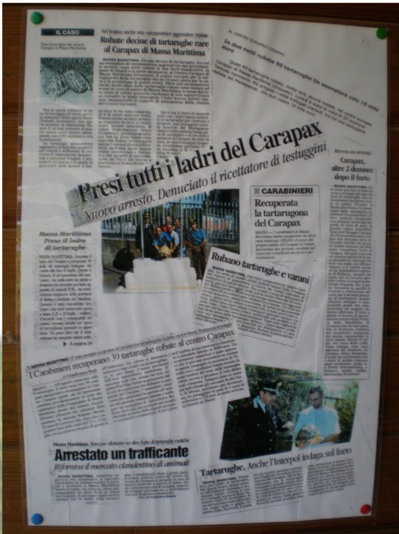
Coupages de presse sur les saisies anti-traffic.